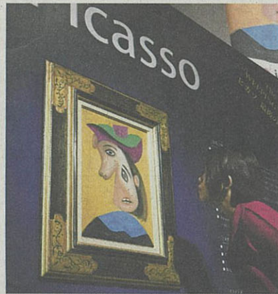
10億円で落札されたピカ ソの油彩「泣く女」（2 日、東京都渋谷区）

外環道のうち未完成は 東京都の大泉JCT—東 名JCT。地下深くにト ンネルを掘るため工事が 難しく、開通は2020 年東京五輪・パラリンピ ック後になる見込み。